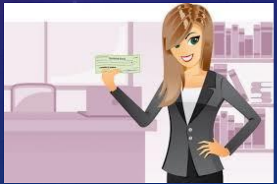
ธนาคารพาณิชย์ ที่ทำ MOU