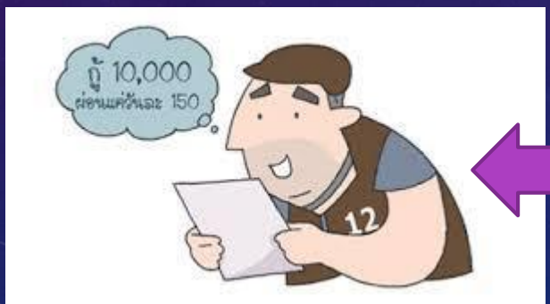
เป็นหนี้แล้วเรา